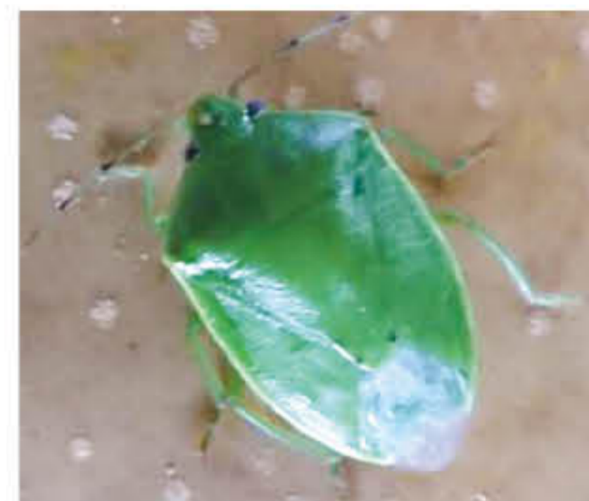
左: なし果実にいるチャバネアオカメムシ(成虫) 右: 近年増加が見られるツヤアオカメムシ(成虫)

お問合せ先: 安足農業振興事務所 経営普及部 TEL: 0283-23-1431