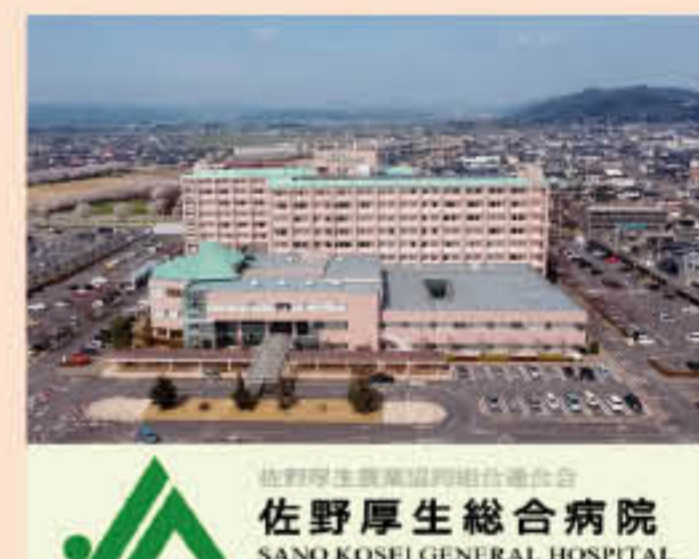
佐野厚生農業協同組合連合会 佐野厚生総合病院 SANO KOSEI GENERAL HOSPITAL