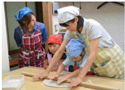
常盤支店 親子そば打ち体験教室