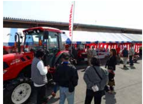
営農経済春の感謝祭・農機展示即売会