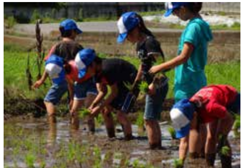
第2回あぐりスクール「夢」