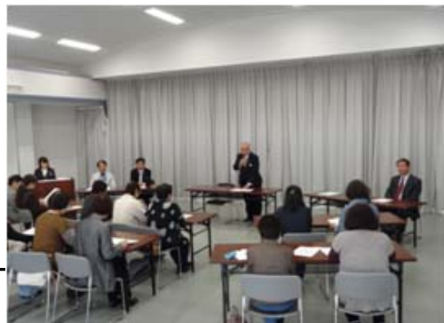
女性会中央支部設立