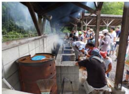
あぐりスクール「夢」デイキャンプ