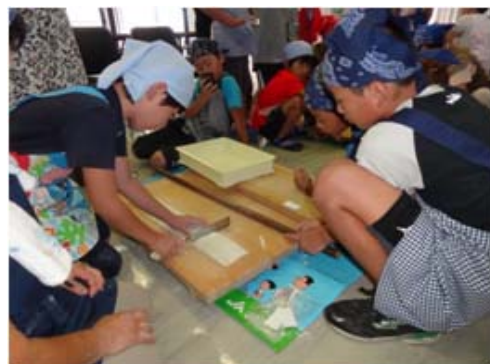
常盤支店 親子耳うどん教室