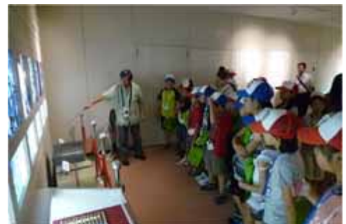
あぐりスクール「夢」バスツアー