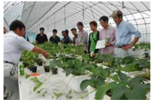
イチゴ新品種「栃木i27号」の 試験定植検討会