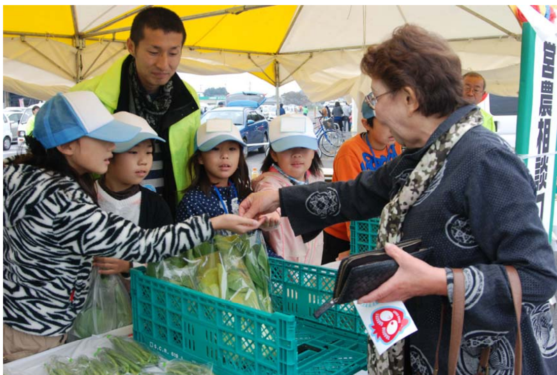
第11回JA佐野農業まつり