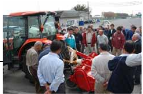
農作業安全講習会